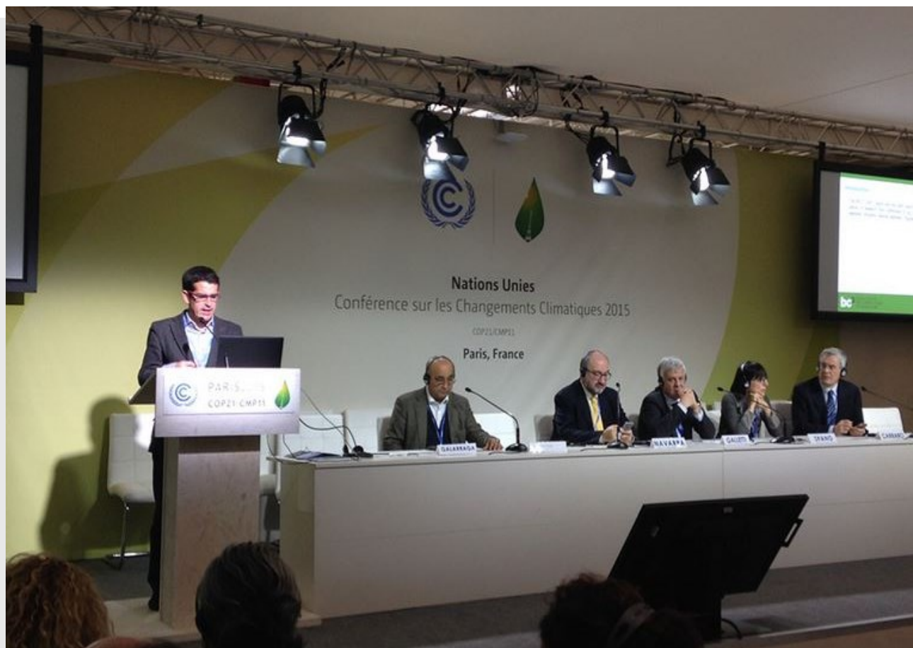
BC3k COP21-CMP11an antolatutako ekitaldia (Paris 2015) "Regions and Climate Change: A major challenge for local communities" (Erregioak eta klima-aldaketa: erroka handia tokiko erkidegoentzat), 2015eko abenduak 10 (CMNUCC)

Gobernantzari dagokionez, hitzarmenean baldintza berezi bat aurreikusi da: klimaren arloko politikak maila guztietan integratzea , bai emisioen merkatuen kasuan, bai nazioko, erregioko eta tokiko bestelako politiken kasuan. Horrekin berariaz aitortzen da beste eragile batzuek egindako lana, hala nola, gobernuak, enpresek eta erregioetako eta tokiko beste hainbat eragilek. Hitzarmenaren beste lorpen bat klima-aldaketaren arrazoiak eta ondorioak aurkako borrokaren zirkulua itxi izana da, egokitzeko (klima-aldaketaren eragin saihestezinetara) eta kalte-galerei (egokitzeak saihestu ezingo dituenek) aurre egiteko helburuak eta baliabideak barne direla. Alde horretatik, Hitzarmenean herrialde zaurgarrienei lankidetzaren mekanismoen bidez (teknikoak eta finantzarioak) laguntzearen aldeko aukera egin da, eta ez da konpentsazio-metodoa eskatzen , horixe izanik negoziazioaren oztipoetako bat.